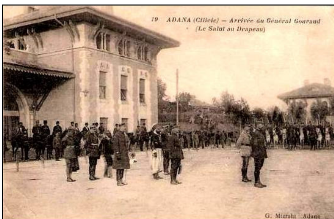
Adana – Arrivée du Général Gouraud (Le salut au drapeau)